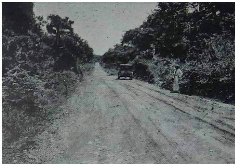
Figura 2. Estado da estrada Ilhéus-Itabuna apresentado no relatório de 1935